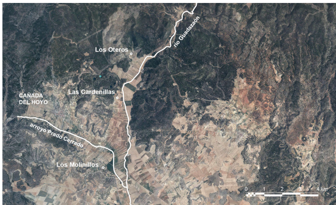
Fig. 1. Dispersión de los hallazgos epigráficos en Cañada del Hoyo sobre ortoimagen IGN.

Las otras dos inscripciones de Cañada del Hoyo proceden del lagunillo Las Cardenillas y de la finca Los Oteros, situadas también en la orilla derecha del río Guadazaón, a unos 4 y 6,5 km respectivamente aguas arriba. El patrón de asentamiento que presentan las villae de esta zona del ager valeriensis parece determinado por la explotación de los recursos agrícolas que proporcionan las fértiles vegas del Guadazaón y sus afluentes. Las edificaciones se debieron situar ligeramente en alto con respecto a las llanuras de inundación, evitando avenidas, humedades, nieblas y otros inconvenientes producidos por la excesiva cercanía a los cursos fluviales (fig. 1).