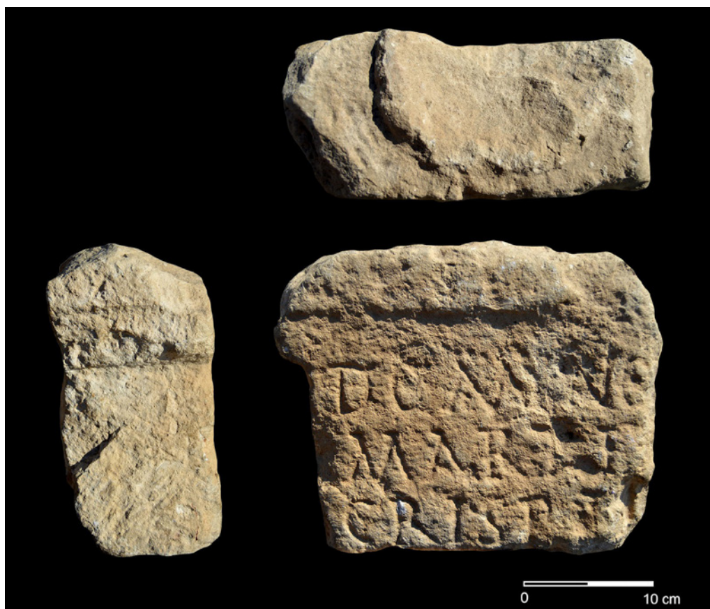
Fig. 3. Ara votiva al dios Marte dedicada por Crispina . Cara superior, frontal y lateral izquierda.