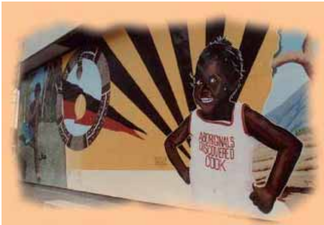
Fig. 5.- Una visión indígena del mundo, que invierte los estereotipos coloniales.

La supervivencia de las culturas indígenas también puede verse favorecida al compartir los beneficios que se derivan de la investigación. El sistema heredado de las estructuras coloniales es aquel en el que los académicos acumulan los beneficios a largo plazo de la investigación, mientras que las poblaciones indígenas no obtienen ningún beneficio, o tan sólo a corto plazo. Y eso a pesar de que la mayoría de la investigación arqueológica se adquiere a través del conocimiento indígena, y una gran parte de la misma no podría producirse sin su ayuda. Si bien los investigadores aportan sus conocimientos a los proyectos, a menudo no aportan los datos primarios. Tanto unos como otros tienen derechos sobre la propiedad intelectual que surge de tal investigación, ya que ambos son esenciales para la obtención de resultados. Una forma de conceptualizar esta idea es pensar en la investigación como una especie de sopa, en la que