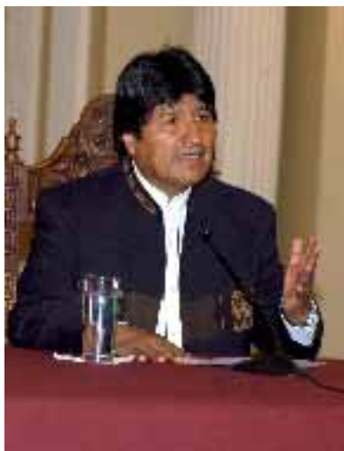
Fig. 8.- Evo Morales, Presidente de Bolivia desde enero de 2006.

Entre los resultados positivos cabe destacar el creciente reconocimiento del papel clave jugado por los pueblos indígenas que viven a lo largo de Asia y del Pacífico en la conservación del bosque, y la creciente utilización de los conocimientos indígenas para la comercialización de tecnologías biomédicas innovadoras que mejoran la salud humana. Alrededor del 62 % de todas las drogas contra el cáncer aprobadas por la Administración de Alimentación y Farmacia de los Estados Unidos