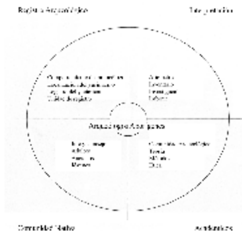
Fig. 3.- Modelo de investigación circular de Tara Million

“Si nos fijamos en algunos de los conceptos que tienen estas comunidades sobre el pasado, las formas tradicionales de enseñar su historia, su patrimonio y sus restos ancestrales, y el papel y la responsabilidad de los conocimientos de la investigación para las comunidades, estaremos en disposición de concebir un tipo de práctica arqueológica muy diferente –aquella que pone énfasis en la ética y en la justicia social destinada a una audiencia más amplia y diversa” (Atalay 2006, 295-96).