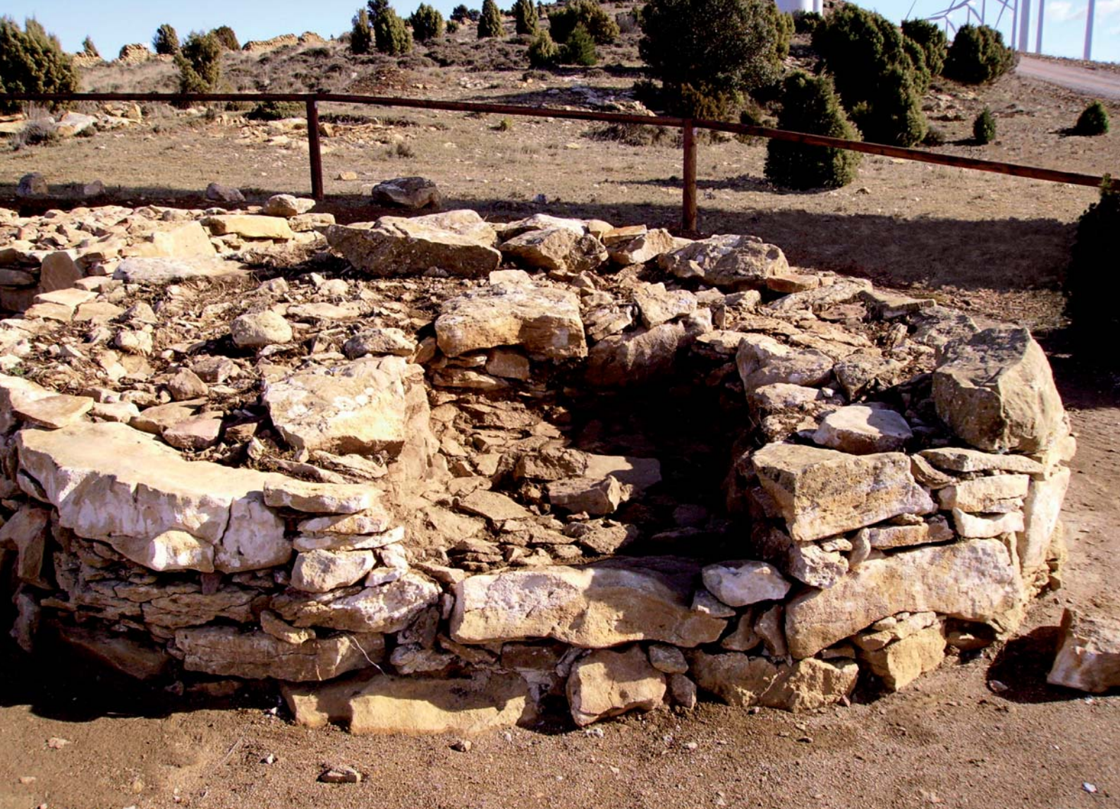
Figura 3. Estructura circular amb cambra excèntrica de maçoneria i cista (E1).

bra, excepte E19 i E25 que no en tenen. A la cara exterior de la cambra se li adossa un sòcol de 35 cm de gruix fet amb els mateixos materials que la resta de l'estructura.