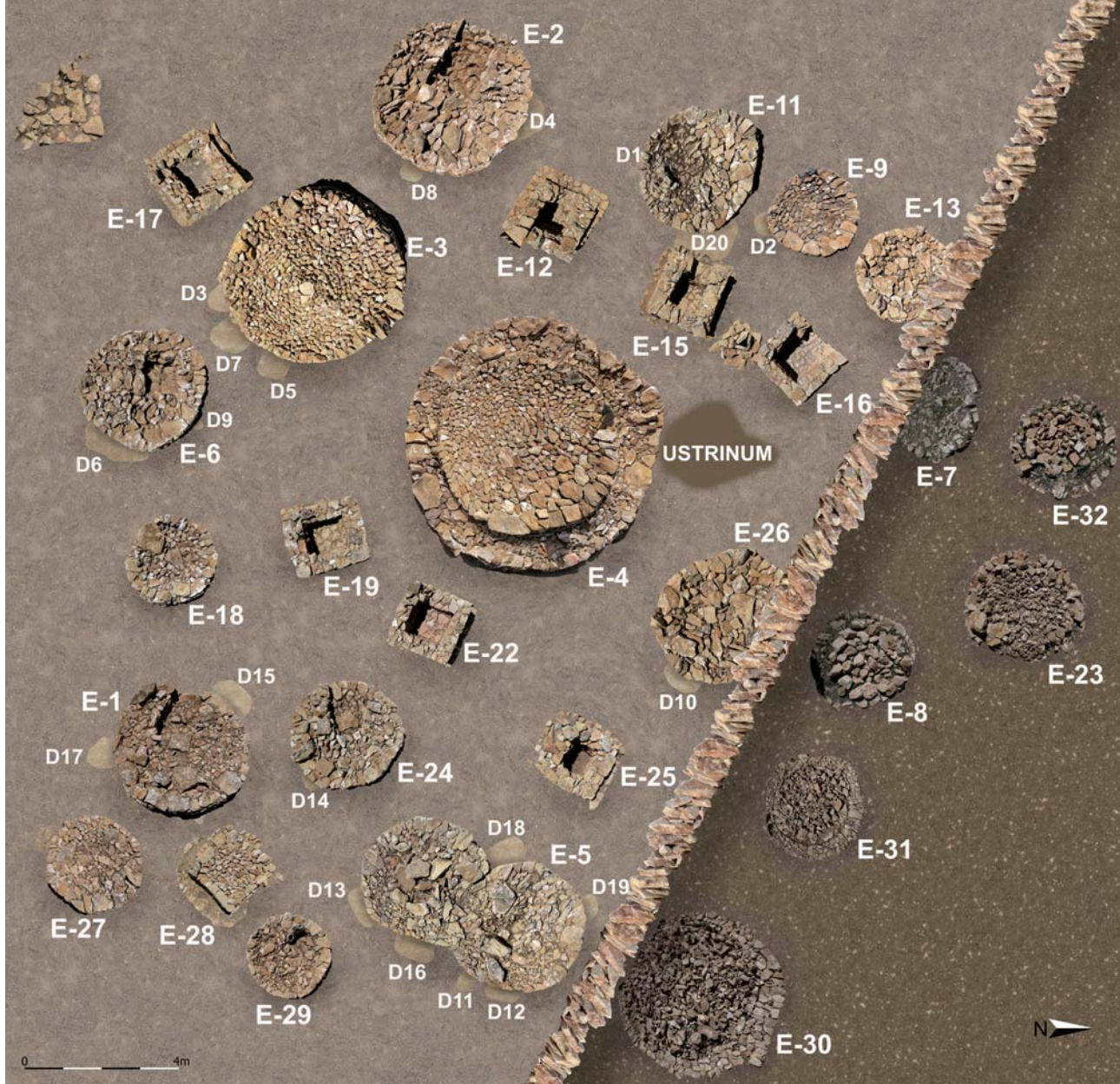
Figura 2. Ortofoto de la necròpolis després del procés de consolidació i posada en valor.

Finalment, les cambres funeràries de tipus C són estructures de planta quadrangular, construïdes amb murs de maçoneria a doble cara, els quals s'alcen amb blocs i lloses de calcàries locals de mides diverses travades amb terra. La grossària d'aquests murs és de 40 cm i delimiten un espai intern de 85 x 90 cm de mitjana, on es deposita l'urna amb les restes incinerades i l'aixovar. El paviment de la cambra es forma amb pedres planes col·locades a manera d'enllosat o amb margues compactades. Creiem que les cares internes dels murs van estar