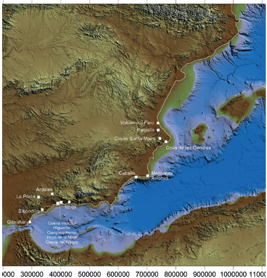
FIGURA 2. Principales yacimientos paleolíticos que actualmente tienen una localización litoral; se incluyen también yacimientos interiores con representaciones marinas. La tierra emergida corresponde a la cota -120 m.s.n.m., que sería la posición de la línea de costa durante el Último Máximo Glacial (a partir de Aura et al., 2019). En trazo blanco se indica la línea de costa actual. La batimetría y el modelo digital del terreno se basan en EMODnet Bathymetry ( http://www.emodnet-bathymetry.eu ).

causada por el ascenso del nivel del mar, así se ha observado al menos en Nerja (Jordá Pardo et al., 2011). A esta situación se añade el hecho de ser una de las áreas de mayor productividad primaria de todo el Mar Mediterráneo (Coll et al., 2010), lo que pudo favorecer procesos adaptativos regionales y cierta concentración de sitios paleolíticos (Aura et al., 2016).