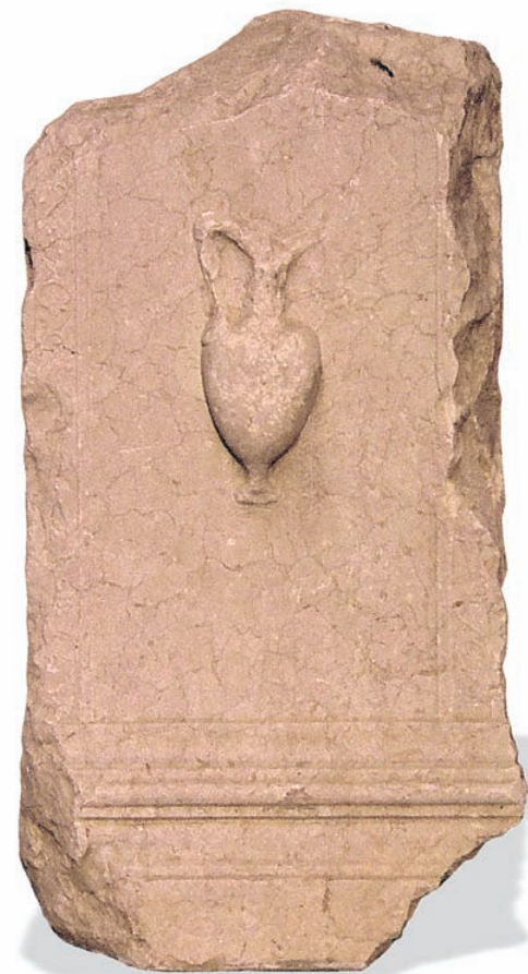
Urceus tallat en una de les cares laterals d'una ara trobada a Riba-roja de Túria. [Museu de Belles Arts de València].

Els tipus dels suports epigràfics utilitzats en l'àmbit funerari de l'àrea valenciana proporcionen una valuosa informació sobre els monuments que van situar-se en les necròpolis. En els grans centres urbans, com Saguntum , Valentia o Edeta , les necròpolis albergaren una gran varietat de monuments epigràfics, mentre que a les zones rurals i nuclis petits predominà la senyalització dels llocs de soterrament mitjançant suports en forma d'esteles.