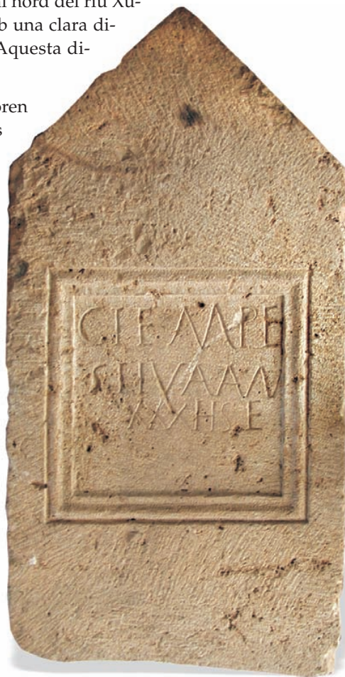
Estela de Tempestiva, trobada a Pedralba. [Museu de Prehistòria de València].

Els diferents tallers lapidaris que treballaren en l'àrea valenciana oferiren a la clientela una variada gamma de suports petris amb inscripció per a senyalitzar les seues tombes en les necròpolis. Al llarg del període imperial, la producció va seguir els estils i les modes desenvolupades a Roma i a les capitals provincials de Tarraco i Carthago Nova . L'ambient artesanal de les officinae lapidàries valencianes es caracteritzà per una forma de treball similar, repetint-se els mateixos tipus de su-