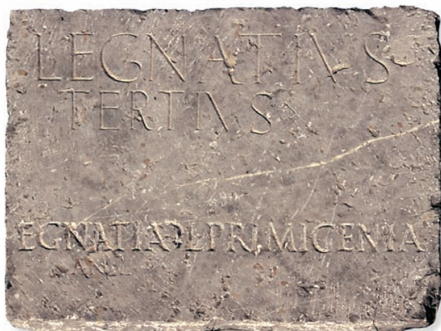
Inscripció funerària de dos lliberts de la família Egnatia de Saguntum. [Museu Arqueològic de Sagunt].

Els lliberts podien ser soterrats en els mausoleus dels seus patrons. La placa va ser gravada en dos moments distints.