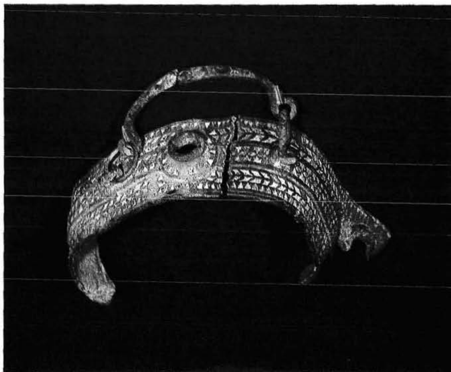
Fragmento de la cantimplora de Bélgica.

Museo Británico de Londres, igualmente en otras menores de Cheshers (Chorthumberland), quizás de un taller del Sur de Inglaterra de cronología posterior al 122, fecha adrianea de la creación de la famosa muralla en la Gran Bretaña; pero tampoco es suficiente este ejemplar para pensar en origen y cronología del ejemplar de Bélgica.