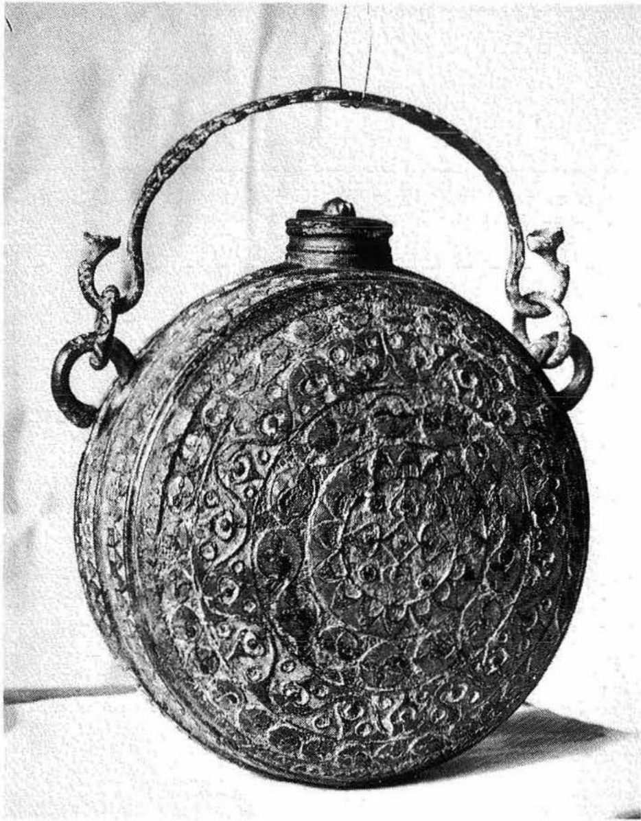
Lateral de la cantimplora de Pinguente.