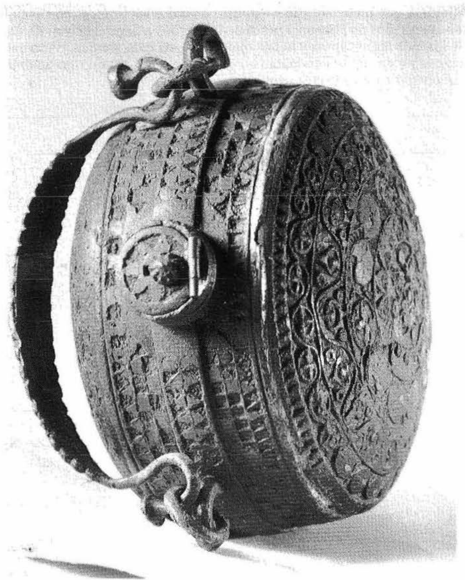
Parte superior de la cantimplora de Pingente.